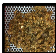
Bouse avec levures vivantes